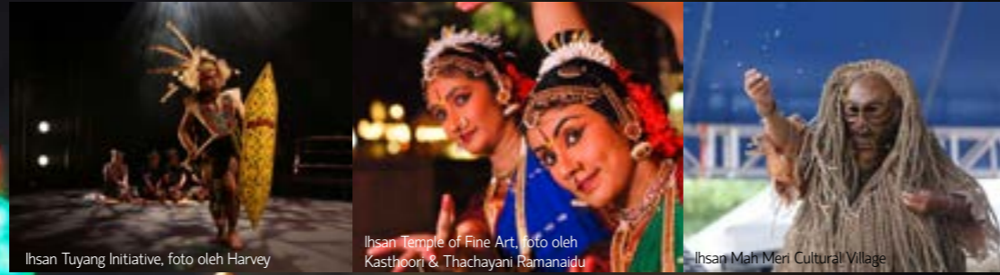
Ihsan Tuyang Initiative